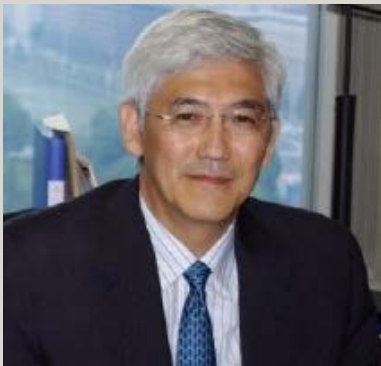
IMF Consultant former Director, IMF Office for Asia and Pacific

Content: The lectures will provide an overview of how the IMF analyzes macroeconomic issues, including through the use of its financial programming tool. Real country case studies of IMF surveillance and program activities will be discussed. Students will have the opportunity to take part in their own analysis of a country case, using the tools introduced in the class.