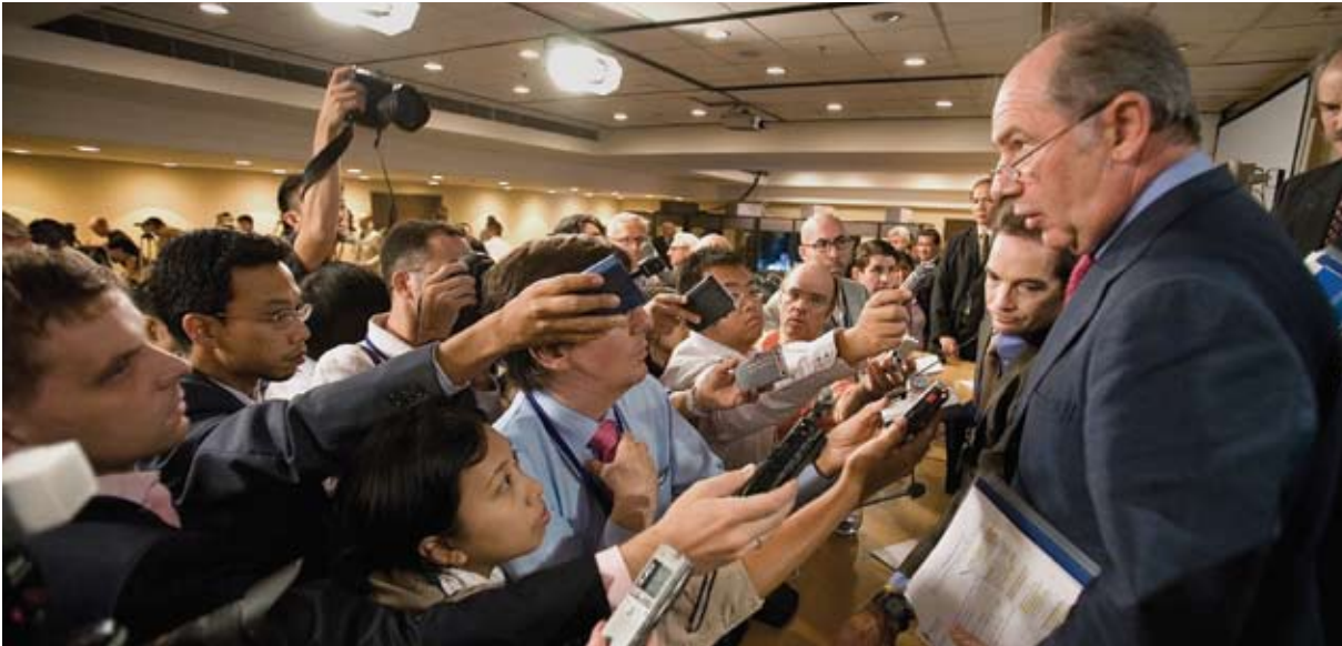
Le Directeur général du FMI, Rodrigo de Rato, s'adresse à la presse lors de l'Assemblée annuelle de 2006 à Singapour

dirigeants politiques, grands investisseurs internationaux et représentants des milieux d'affaires d'Amérique centrale et de la République Dominicaine 61 . Le FMI et la Banque mondiale ont contribué à l'organisation de cette conférence au Costa Rica.