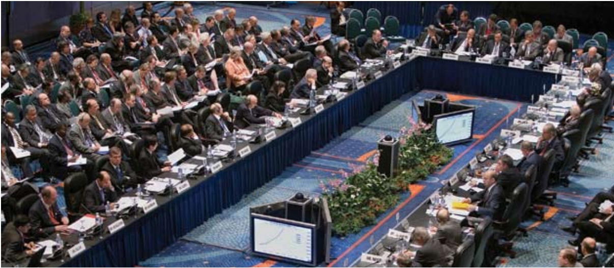
Réunion du CMFI lors de l'Assemblée annuelle de 2006 à Singapour

Durant l'exercice 2007, le taux de publication des rapports sur les consultations au titre de l'article IV et sur l'utilisation des ressources du FMI a augmenté pour la troisième année consécutive, passant de 82 % du total des rapports en 2005 à 85 % en 2006. Le nombre de pays membres ayant rendu publics tous les rapports sur les consultations au titre de l'article IV et sur l'utilisation des ressources du FMI est passé de 136 en 2005 à 142 en 2006. La proportion des évaluations de la stabilité du secteur financier (rapports établis dans le cadre du Programme d'évaluation du secteur financier) rendues publiques a atteint 82 %. Quant aux documents annonçant les intentions de politique économique des pays qui concluent un accord avec le FMI et aux notes d'information au public (NIP), leur taux de publication est monté à 94 % 66 .