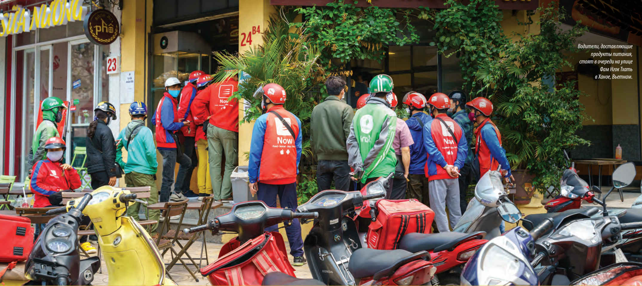
Водители, доставляющие продукты питания, стоят в очереди на улице Фам Нгок Тхат в Ханое, Вьетнам.