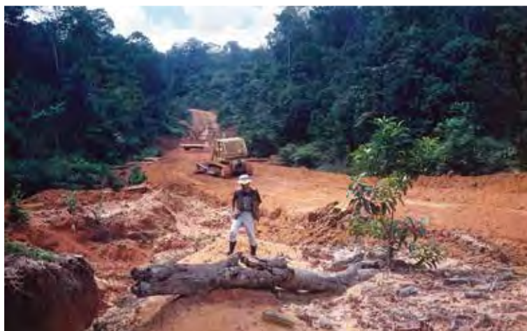
Excavadoras limpian una carretera recientemente construida en el corazón de la gran selva central de Kalimantan, Indonesia.

que perjudica sectores clave como agricultura, turismo y pesca —junto con la salud humana y la productividad laboral— según la estimación del BAsD en un informe de 2015, que es muy superior a la estimación de 2009 del 6,7%.