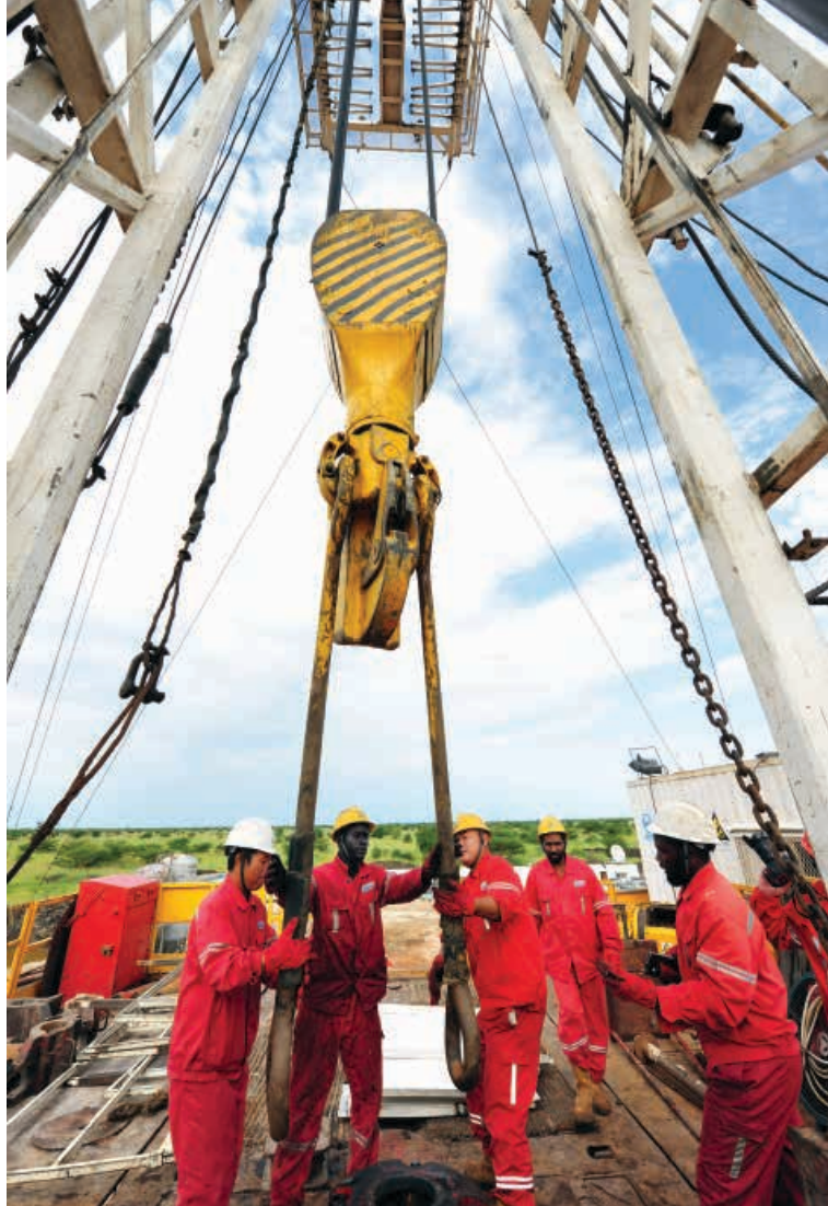
来自中国石化中原石油勘探局的中国工人和苏丹工人在南苏丹钻井。

撒哈拉以南非洲地区就是一例，过去20年中，贸易发生了巨大变化。1995年，发达经济体占撒哈拉以南非洲地区出口的近90%，而如今，巴西、中国、印度等新贸易伙伴所占比例超过50%，其中中国承担了一半出口。而且，2014年，中国成为撒哈拉以南非洲地区的最大的进口来源国。