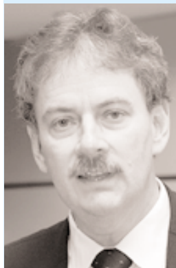
Van den Bergh: La red que se establezca será útil.

Banco Central Europeo (BCE), entidades gubernamentales de varios países industriales y en desarrollo, y empresas privadas en algunos países, como Absa Group en Sudáfrica, compilaron y trataron de generar índices a nivel regional y nacional para medir la evolución de los mercados inmobiliarios y de activos. Arthur afirmó que los índices agregados de precios de activos serían un añadido muy provechoso al conjunto de variables que consideran las autoridades desde la perspectiva de la estabilidad monetaria y financiera, pero el consenso se inclinó a favor de una familia de indicadores, los cuales serían útiles para muchos otros fines oficiales y privados, como la administración de impuestos, la política agraria, las disposiciones sobre constitución de reservas bancarias y las decisiones para invertir en el sector inmobiliario.