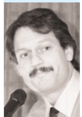
Verdier: Los países con instituciones deficientes sufren la maldición de la abundancia.