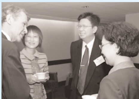
Charles Enoch (izq., FMI), Ruan Jiamhong (Banco Popular de China), Chung Chee Leong (Banco Central de Malasia) y Xiu-zhen Zhao (FMI).

Como parte de un esfuerzo internacional por reforzar la supervisión del sistema financiero, el 29 y 30 de octubre se reunieron expertos de 17 países miembros y 6 organismos internacionales y regionales para examinar el último borrador de la Guía del FMI para la compilación de indicadores de solidez financiera. Ésta fue la segunda reunión de este tipo con miras a concluir el borrador y proponer un programa de trabajo para ayudar a los países miembros a compilar los indicadores.