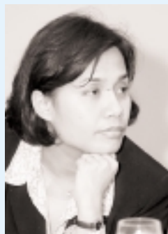
Sri Mulyani Indrawati, Directora Ejecutiva del FMI, asistió al seminario de Singapur.

Washington. Así lo hacen también los representantes residentes y el personal del FMI que los visita.