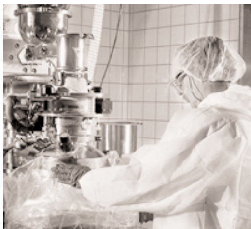
La población activa de Alemania es una de las más productivas del mundo. En la foto, un empleado de la empresa Bayer produce medicamentos.

BOLETÍN DEL FMI: La economía alemana se ha mantenido estancada durante los últimos tres años y el déficit fiscal supera el límite establecido en el (Continúa en la página 330)