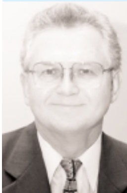
Haurin: Es mejor que sea correcto el índice de precios porque el efecto de los picos y valles puede explicarse por errores en los datos.