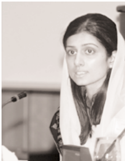
Hina Rabbani Khar, miembro del Parlamento de Pakistán, en la reunión de Singapur.

En cuanto a su propio papel en el proceso de reforma económica, varios parlamentarios señalaron que carecen de la información de la que habrían deseado disponer sobre el proceso presupuestario y sobre la aprobación de los acuerdos crediticios de las instituciones financieras internacionales con sus gobiernos. Las deliberaciones pusieron también de manifiesto que el alcance del debate parlamentario sobre las reformas económicas y la elaboración y aprobación formal de los DELP varía de un país a otro según la estructura institucional existente. Dilli Raj Khanal, de Nepal, captó la actitud general de los