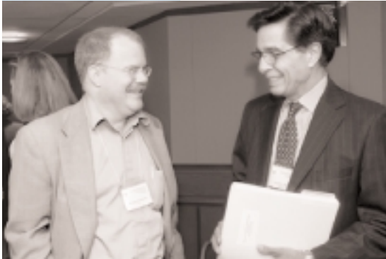
William Easterly (izq.) y Mohsin Khan.

Esto se explica porque las economías más pequeñas, medidas según el PIB, tienen más dificultades de acceso que las grandes, lo que lleva a pensar que los costos fijos de endeudamiento pueden ser muy disuasivos. La estabilidad política y las calificaciones de los inversionistas institucionales importan: mayor riesgo político y menor calificación se traducen en menos acceso. La vulnerabilidad, medida como proporción de la agricultura en el PIB, también suele influir en el acceso a los mercados. No debe sorprender que la existencia de un programa del SCLP respaldado por el FMI influya negativamente: estos programas restringen estrictamente el endeudamiento en el mercado privado, y los países de bajo ingreso por lo general tienen poca capacidad de servicio de la deuda. Por último, las cesaciones de pago no parecen incidir en el acceso, y el período transcurrido entre la cesación y la reanudación del acceso fue considerablemente más corto en los años noventa que en los ochenta, cuando promedió cuatro años.