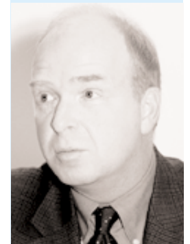
Prud'Homme: Los índices hedónicos son los únicos válidos.