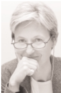
Stephansen: La armonización de datos y metodologías facilita las comparaciones entre países.