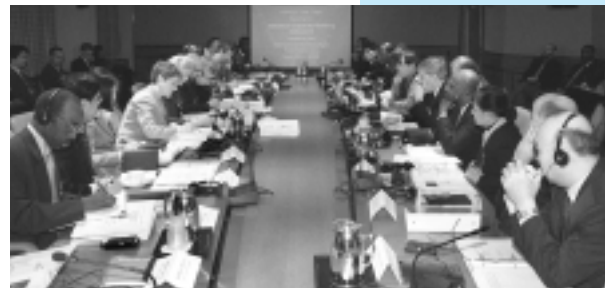
Los participantes durante la sesión de apertura del seminario sobre indicadores del fortalecimiento de la capacidad estadística.

bien público internacional; tercero, las autoridades de los países llegarán pronto a un punto crítico a partir del cual tendrán que ir superando gradualmente la dependencia de la ayuda externa y sustentar su capacidad estadística con sus propios recursos; es imperativo, entonces, que se preparen para esta transición.