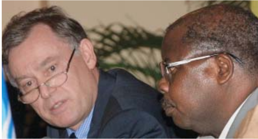
基金组织总裁霍斯特·克勒与坦桑尼亚总统Benjamin William Mkapa在2001年达累斯萨拉姆的联合记者招待会上。

设了第一个非洲技援中心——东非技援中心。东非技援中心的成员国有：厄立特里亚、埃塞俄比亚、肯尼亚、卢旺达、坦桑尼亚和乌干达。东非技援中心的工作人员包括一位中心协调人和五位常驻专家。他们的工作由短期专家补充。坦桑尼亚政府为该中心提供办公场所和后勤支持。