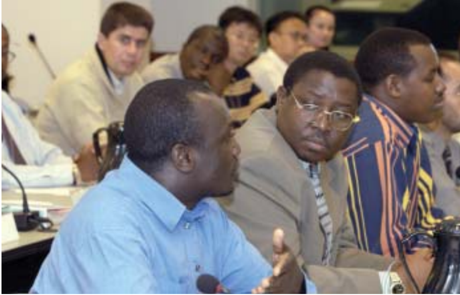
出席基金学院课程的政府官员。

几年，基金学院特别强调帮助各国防范和管理金融市场危机。第三，基金学院举办有关当前主要问题的短期研讨会，以适合高层官员的需要。最近的研讨会涉及汇率制度、财政规则、全球化、投资者关系、通货膨胀目标制和减贫。最后，基金学院的工作人员保持积极的研究计划，以便确保基金学院的培训计划涵盖重要的主题和具有最高水准。基金组织公布这些研究成果以及培训材料和案例分析。