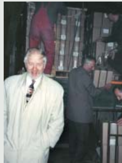
基金组织任命的中央银行行长，新西兰的Peter Nicholl，高兴地看着人们卸下第一批装有在法国印制的新钞票的箱子。

基金组织在建立战后经济制度方面发挥关键作用，并负责任命波斯尼亚新中央银行的外籍行长。从某种程度上说，代顿/巴黎和平协议所设想的高度分散的政府体系，以及重要决定由以前敌对的三方之间的共识做出这一要求，使得这一工作变得更加复杂。基金组织工作人员坚持不懈地在该国各地开展工作，在他们的帮助下，1996年建立了联邦范围的财政和金融体系；1997年建立了最初的政府机构，包括中央银行；1998年全面接纳塞尔维亚共和国、成功推出波斯尼亚新货币以及波斯尼亚获得第一笔基金组织备用安