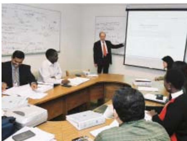
授课人在华盛顿举办的课程上向学生提供帮助。

过去几年，在联合维也纳学院（见下页）的有益经验的基础上，基金学院建立了由设在奥地利、巴西、中国、科特迪瓦、* 新加坡和阿拉伯联合酋长国的六个地区培训学院和计划组成的一个网络。建立这一网络，基金学院可以大幅扩展培训，并借助地区培训伙伴的贡献，包括提供教学设施、行政管理资源和共同筹集