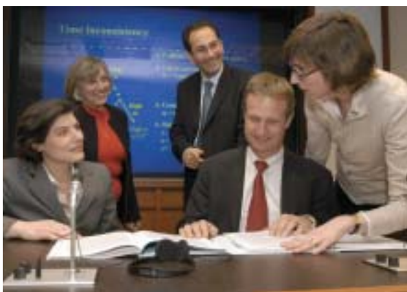
基金学院的教员讨论讲座议题。

基 金组织以多种方式提供技术援助。首先，在有关国家开展工作。基金组织工作人员可以前往一国进行短期访问，通常为期两到三周；或者，可以派遣专家前往一国，期限从几周到几年不等。派遣这些代表团和专家为