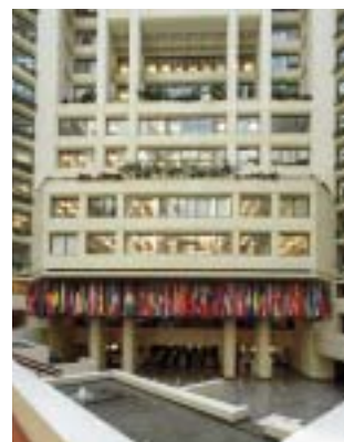
基金组织成员国的国旗。

技 术援助一般是免费向基金组织成员国提供的。例外情况包括向中高收入国家派遣长期专家（定义为在一国居住6个月或6个月以上的专家），这些国家需向基金组织支付规定的缴款。（目前，要求中等收入国家支付部分现金缴款，要求高收入国家报销长期常驻专家的全部费用。）技术援助是基金组织与受援国之间的一项合作，其成功需要认真的准备和资源投入。在此方面，重要的是受援国当局分派相应的工作人员和办公场地及设备、文秘人员、通讯设施、物资供应和公用设施等辅助资源。除基金组织可能收取的任何其他费用以外，受援国政府需支付这些费用。