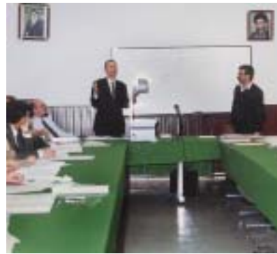
在伊朗培训政府官员。