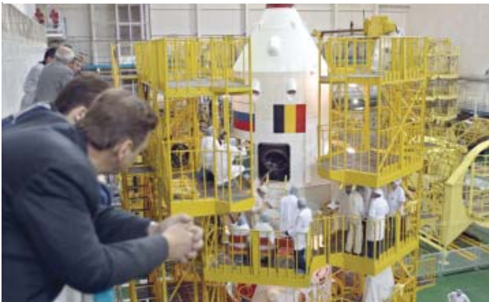
哈萨克斯坦的空间站。

哈萨克斯坦是一个较好的例子。向哈萨克斯坦提供技术援助是为了改进预算管理，包括根据国际标准进行收入和支出分类、财政义务控制、国库单一帐户和分类帐制度以及将预算外资金和预算外帐户纳入预算。基金组织对该国的技术援助于1994年开始，目前仍在继续；提供技术援助的是一位常驻顾问、大量基金组织专家以及造访的其他专家。成就包括：明确和透明的预算法律框架、明确的机构责任以及各预算机构之间的密切协作、体现预算分类的会计科目表、避免额外和预算外活动。取得这些成就有许多原因，包括：对改革的坚定承诺、积极利用基金组织的援助、强调培养利益方的大力支持、各技术援助提供者之间的有效协调以及现实的时间表。哈萨克斯坦预算改革的进展已超出了国界，其他国家（例如蒙古）正根据“哈萨克模式”采取类似的改革。