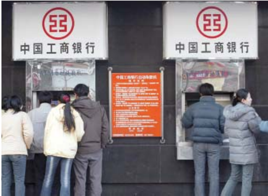
中国的银行部门正在实现现代化。

基金组织还特别与国家税务总局就一系列税收改革项目进行密切协作，目标是使税收征管现代化。这在一定程度上是通过调整国际政策和做法以最好地适合中国经济的独特特点。基金组织就税收法律提供咨询，举办研讨会和讲习班，并安排中国官员到国外进行研究访问。税收制度整体法律框架的改进也得到基金组织技术援助（包括培训）的支持。