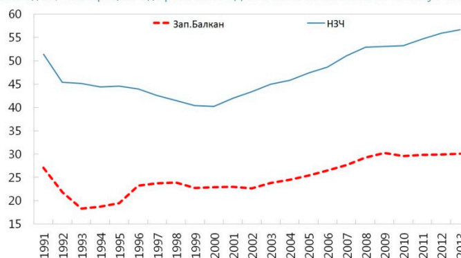
Во чекор со развиена Европа (просечен БДП по глава на жител во државите од ЗБ, како процент од просечниот БДП по глава на жител во 17 ЕУ земји членки)