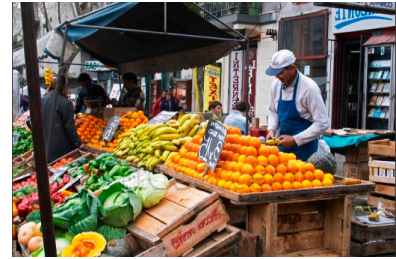
Mercado en Montevideo, Uruguay. El FMI advierte que están surgiendo presiones inflacionarias en América Latina

Boletín Digital del FMI 3 de mayo de 2011