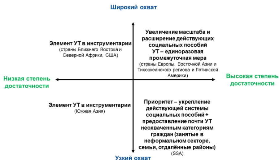
Рисунок 2. В тех случаях, когда это обосновано, меры типа УТ могут быть частью инструментария социальных расходов