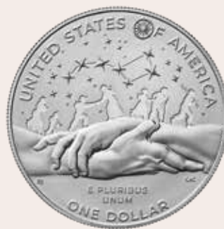
De nouvelles pièces commémoratives mettent Harriet Tubman à l'honneur.

UN HOMMAGE EST RENDU À L'UNE DES personnalités les plus remarquables de l'histoire des États-Unis au moyen de pièces commémoratives à son effigie. Harriet Tubman, abolitionniste avant-gardiste du XIX e siècle qui a échappé à l'esclavage et risqué sa vie à plusieurs reprises pour conduire d'autres esclaves vers la liberté, figurera sur trois pièces de monnaie mises en circulation cette année.