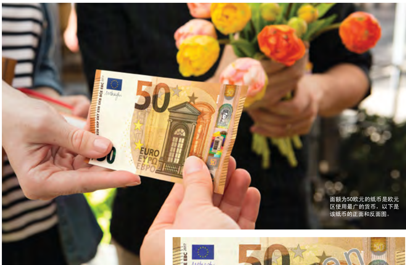
面额为50欧元的纸币是欧元区使用最广的货币，以下是该纸币的正面和反面图。