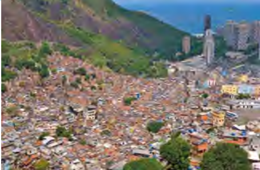
巴西里约热内卢的荷欣尼亚贫民区。

对于拉丁美洲国家而言，自2002年爆发的新兴市场危机之后，其发展势头一路高歌——经济大幅增长，贫困显著减少，收入分配也有所改善。直到2008年开始的经济大衰退才使这一势头稍稍有些受挫。然而，尽管出现了这些积极的发展趋势，但是贫困、不平等、经济和社会边缘化等问题在许多拉丁美洲国家依然普遍存在——从历史的角度而言，这些国家曾是世界上收入分配最不平衡的国家。