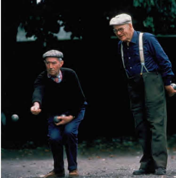
法国布列塔尼，老人们在玩法式滚球游戏。

法国面临的财政挑战既有短期的紧急问题，也有长期的根源问题。短期问题主要是经济衰退，它使法国付出了巨大代价，包括对公共财政直接和间接的影响。直接影响包括财政刺激计划以公共需求取代了私人需求以及对金融部门的支持。间接影响包括与危机相关的收入损失（主要是税收和社会保障收入）、自动稳定器的成